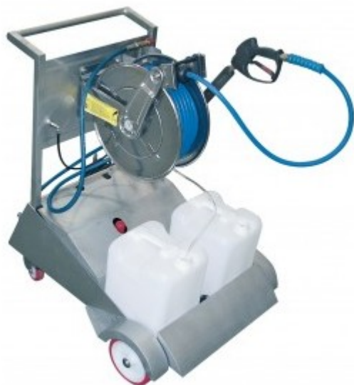
Typ : ARV – 1215 - ADP

Wózek ze stali nierdzewnej o wzmocnionej konstrukcji, wraz z bębnum samozwijającym ze stali nierdzewnej ARV 1215 R, węzłem wysokociśnieniowym, niebieskim, wąż ½ "z okuciami ze stali nierdzewnej, systemem pianującym, pistoletem i lancą.