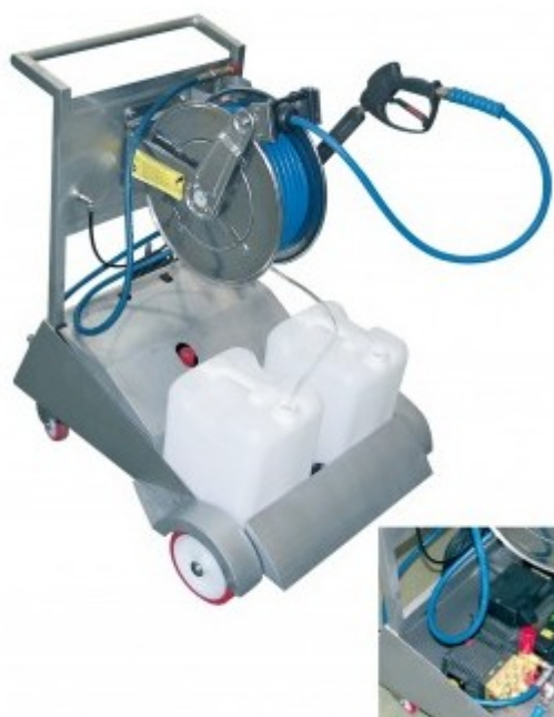
Typ : ARV – 1215 - ADPE

Wózek ze stali nierdzewnej o wzmocnionej konstrukcji, wraz z bębnum samozwijającym ze stali nierdzewnej ARV 1215 R, węzłem wysokociśnieniowym, niebieskim, wąż ½ "z okuciami ze stali nierdzewnej, systemem pianującym, pistoletem i lancą.